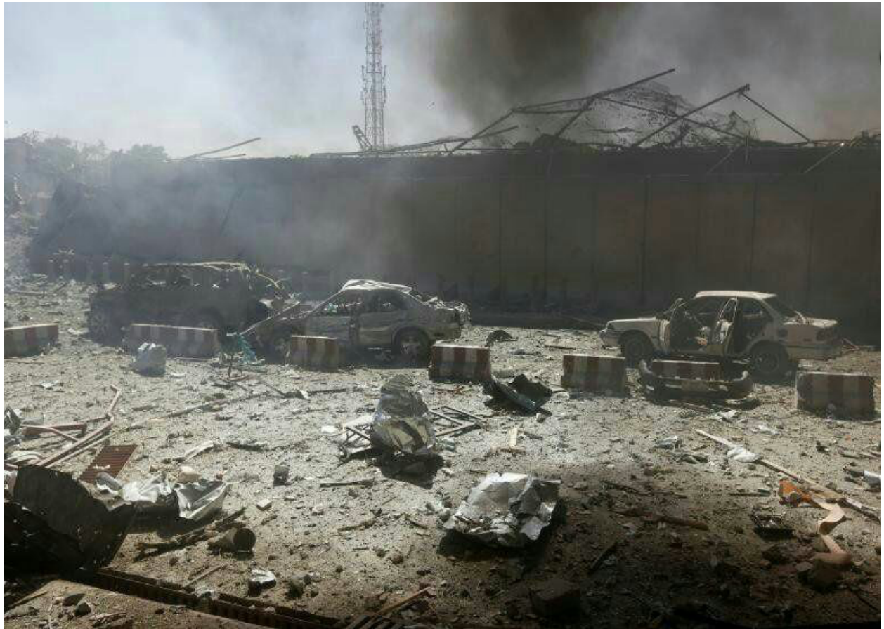
Aftermath of ISKP attack on NDS building

carried out by ISKP against Afghan government was in Kabul on 18th December where inghamasi ISKP fighters attacked building of Afghan intelligence agency NDS.