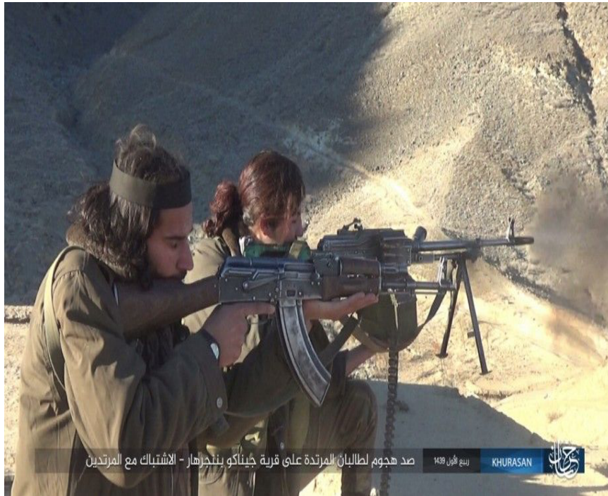
صد هجوم لطالبان المرتدة على قرية جيناكو بننجرهار - الاشتباك مع المرتدين ربيع الأول 1439 KHURASAN

achieving some successes, ISKP is still giving hard time to Taliban in Nangarhar, where ISKP continues to claim more attacks every week, targeting both Afghan security forces as well as Taliban. See ISKP claims for minor and major attacks in Nangarhar here , here , here , here , here , and here . ISKP also recently released a photo report from Nangarhar purportedly showing ISKP battles against Taliban.