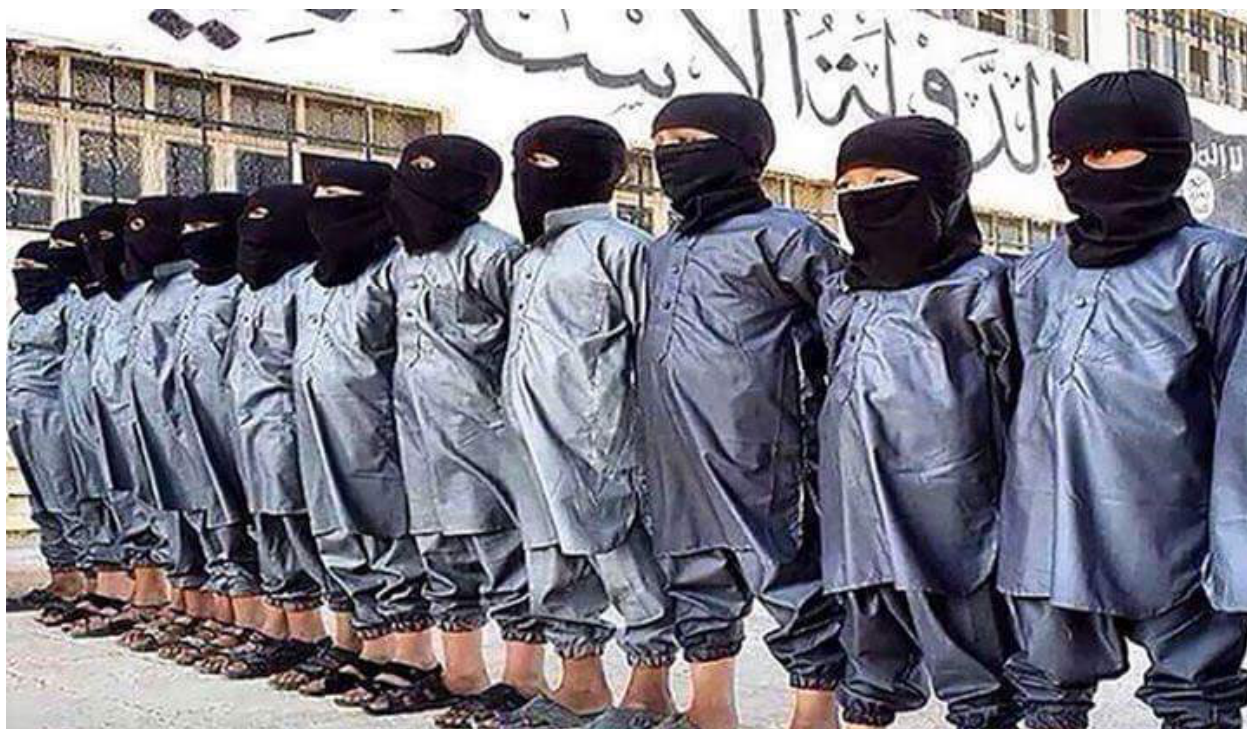
Afghan kids in an ISKP training school